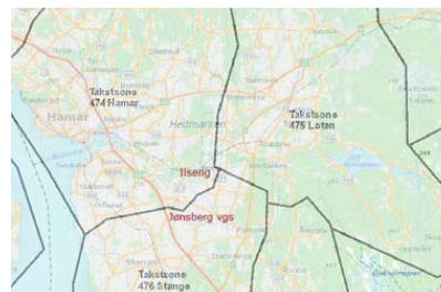
BUSSONER: Sonene er tegnet opp på kartet med svarte linjer.

– Det beste alternativet for skoleelever som ikke har krav på